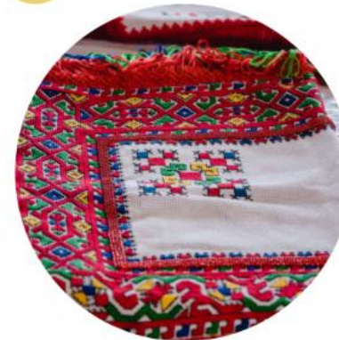
ИЗОБРАЗИТЕЛЬНОЕ И ДЕКОРАТИВНО-ПРИКЛАДНОЕ ТВОРЧЕСТВО, КОСТЮМЫ